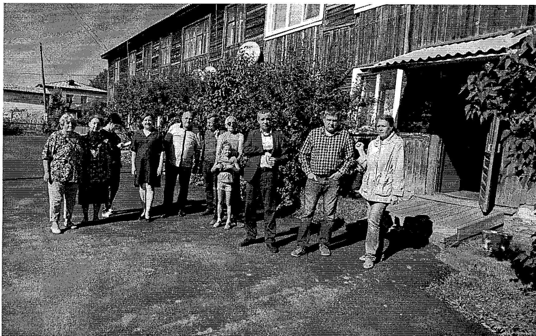
Двор многоквартирного дома по ул.30 лет Победа, д.14