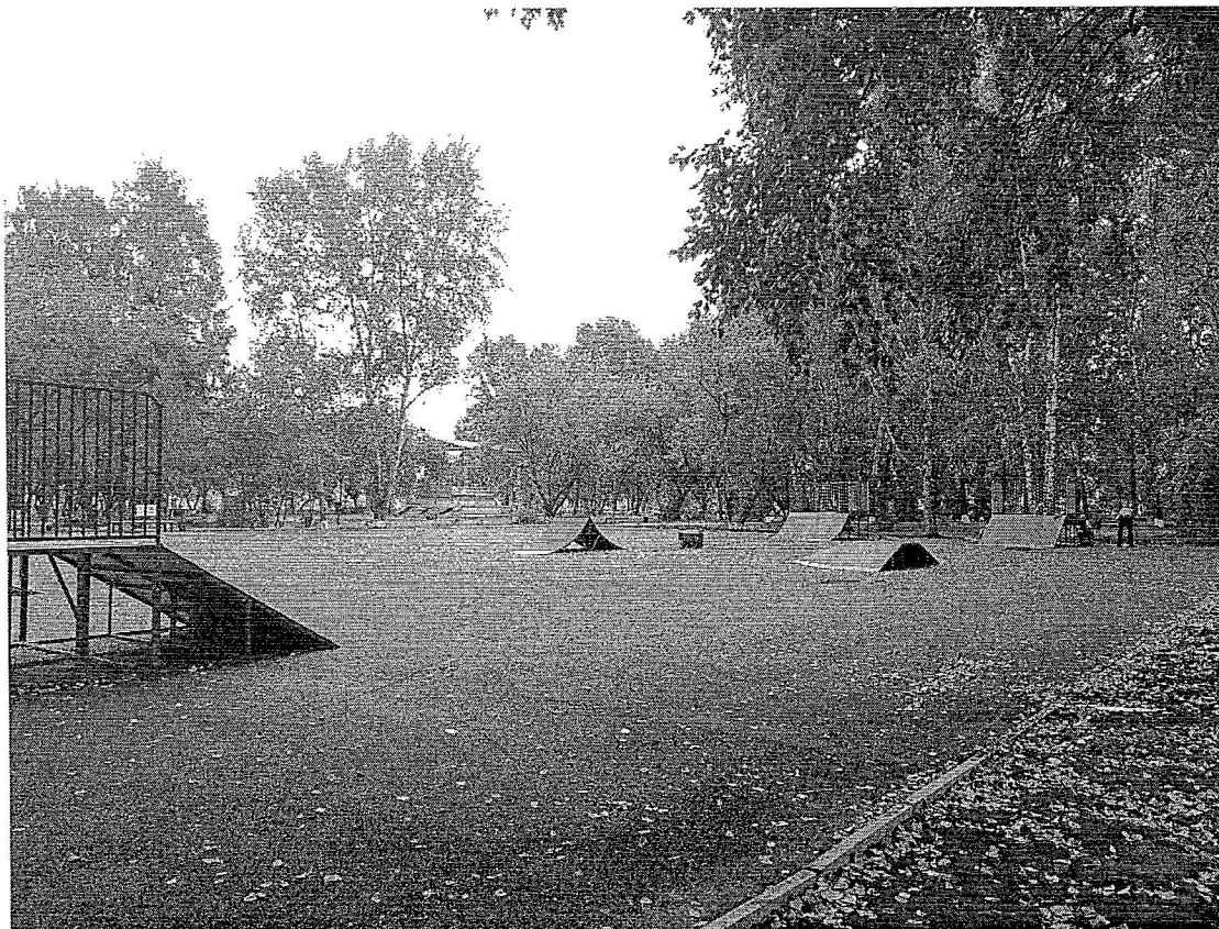
«Городской парк», расположенный по адресу: г.Иланский, ул.Ленина, 566