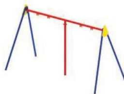
Качели дворовые «плоские сиденья» +