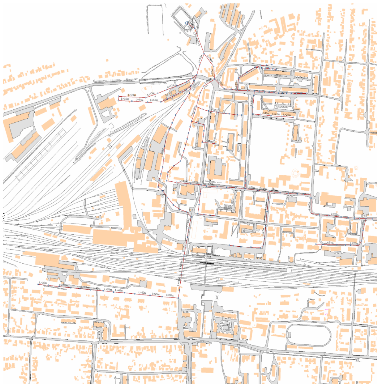
Рис 4. Канализационная сеть г.Иланский

сточные воды проходят обеззараживание на бактерицидных установках и далее по коллектору сбрасываются в р.Иланка.