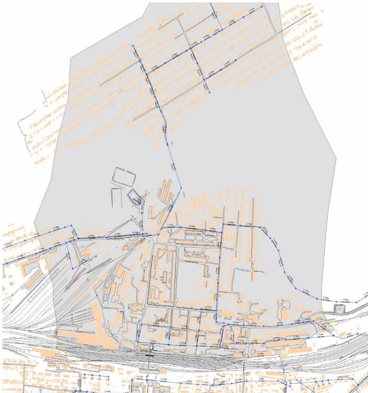
Рис. 1. Зона централизованного водоснабжения г.Иланский